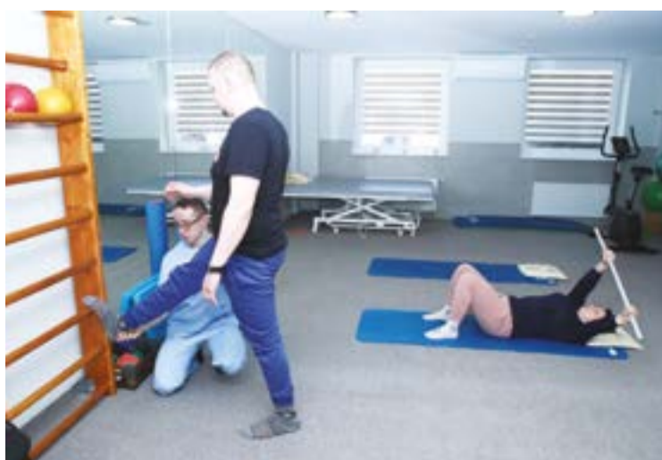
Fizinės medicinos reabilitacijos skyriuje per dieną sulaukiama mažiausiai šešiasdešimties pacientų, atvykstančių net iš Trakų ir Vilniaus rajono, o eilės į pradinę reabilitaciją siekia keturis mėnesius.

Nuo pat centro atidarymo sporto bazę pamėgo ne tik sportininkai, bet ir įvairių įmonių bei įstaigų darbuotojai, susibūriantys kartą ar kelis per savaitę