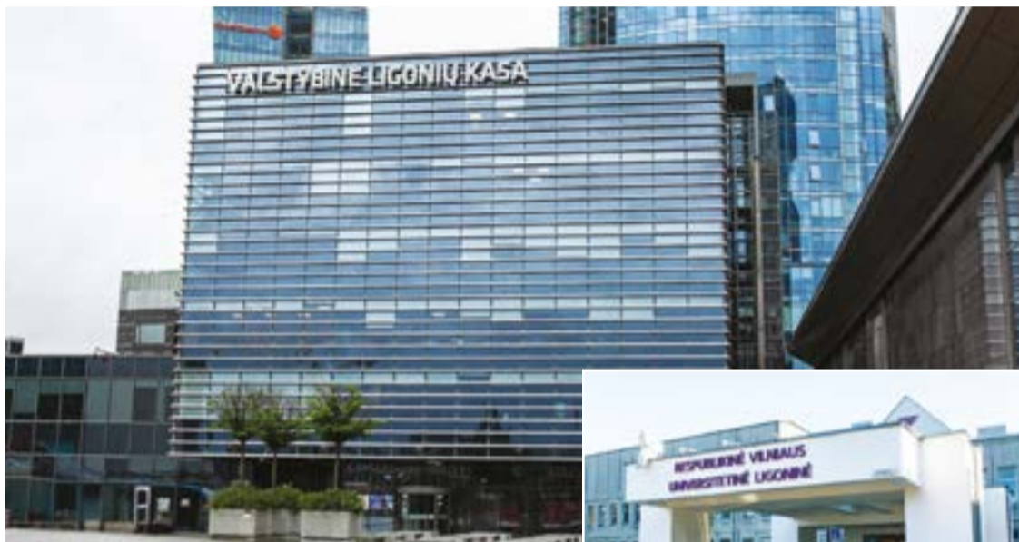
Iš įtampos tarp Valstybinės ligonių kasos (VLK) įkainių ir realių gydymo kainų, kurias dengia ligoninės, gimė pilotinis projektas – VLIVAS (Vieninga ligoninių valdymo ir apskaitos sistema), kurį įgyvendino VLK kartu su Respublikine Vilniaus universitetine ligonine. Projekto tikslas – išsiaiškinti, ar VLK nustatyti gydymo paslaugų įkainiai, apmokami iš PSDF, atitinka realias ligoninių patiriamas sąnaudas.

Bandomajam projektui buvo pasirinkta būtent RVUL. Kodėl? Nes, pasak VLK atstovo, sprendimą lėmė keli kriterijai: įstaigos dydis, paslaugų įvairovė ir įstaigos skaitmenizavimo lygis. RVUL pasižymi didesniu teikiamų paslaugų kiekiu, paslaugos yra skirtingos, pati įstaiga yra pakankamai skaitmenizuota, nes čia duomenys daugiausia renkami elektroniniu būdu, rankinio