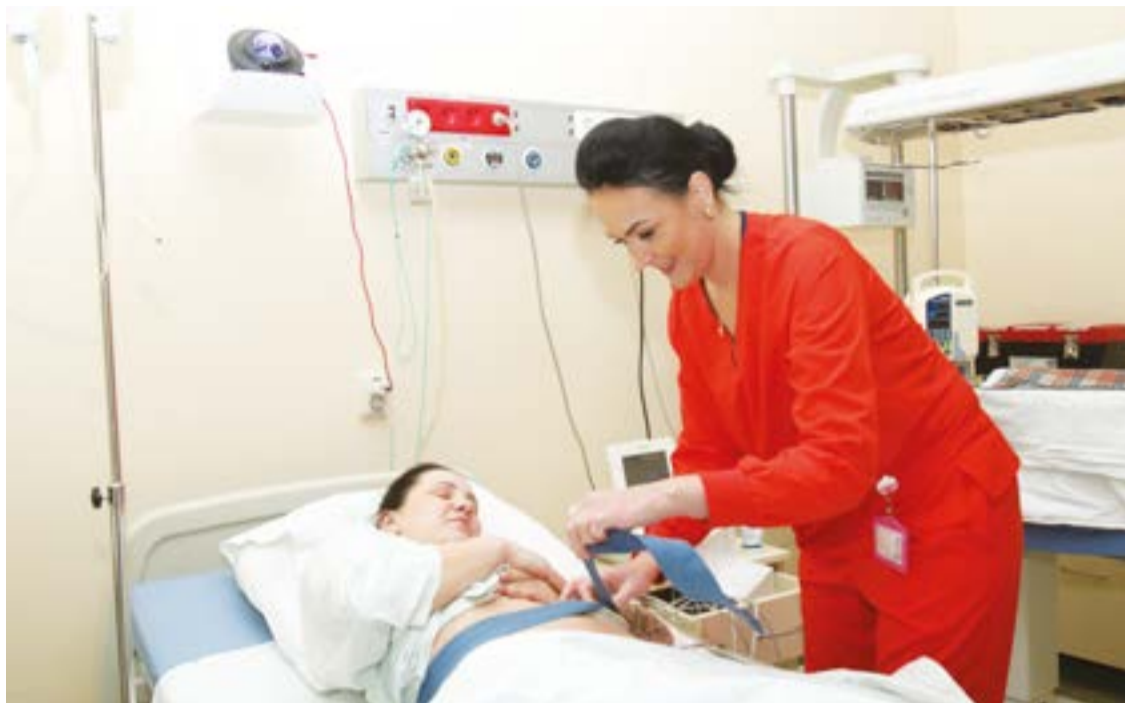
Šių metų pradžioje regioninės ligoninės galėjo lengviau atsikvėpti – nauja valdžia atsisakė ankstesnės Vyriausybės reikalavimo pasiekti 600 gimdymų per metus ir grąžino 300 kartele.

Anot jo, Utenos ligoninė patiria didžiausią nuostolį tarp regioninių ligoninių šalyje. Pernai čia gimė 304 kūdikiai – vos keturiais dau-