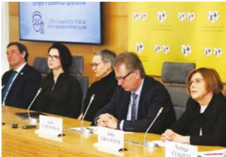
Seime surengtoje spaudos konferencijoje, kaip pagerinti onkologinių ligonių burnos sveikatos priežiūrą, diskutavo politikai ir gydytojai specialistai.