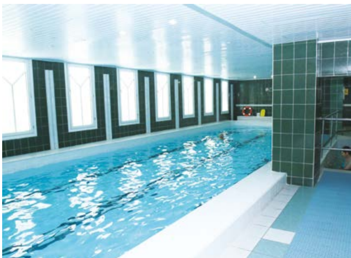
Centras siūlo ne tik medicininės paslaugas – čia veikia dvi sporto salės ir dvidešimt penkių metrų baseinas.

Vien pernai per metus globos namuose surengta keturiolika koncertų – atvyksta ir jaunimo kolektyvai, ir folkloro ansambliai, ir atlikėjai iš miesto. Retkarčiais darbuotojai atsiveža savo augintinius – senjorai jų laukia ne mažiau nei koncertų. Kartais gyventojai išvažiuoja ir patys: pernai lankėsi žirgyne, dalyvavo žirgų terapijoje.