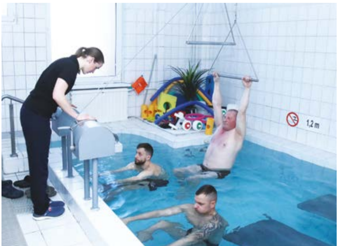
Populiariausios procedūros vyksta vandenyje: kineziterapija baseine, povandeninis masažas.