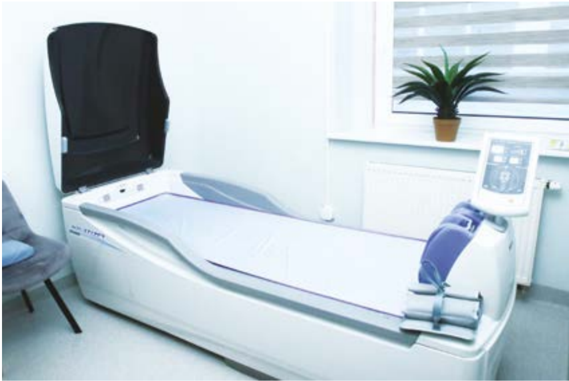
Fizinės medicinos reabilitacijos skyriaus kolektyvas džiaugiasi atnaujinta fizioterapijos kabineto aparatūra: žemo dažnio magnetai malšina uždegimą ir skausmą, Bemerio aparatas aktyvina kraujotaką, hidrosanas gydo šviesą, kompresinė terapija ir elektroterapija padeda atsigaivinti po traumų, kovoti su skausmu, stiprinti nusilpusius raumenis.

„Veiklų tikrai netrūksta. Bet karais svarbiausia ne pati veikla, o bendrystė, pasikalbėjimas, pabuvimas kartu. Čia užsimezga nuoširdžios ir gilios draugystės“, – teigė administratorė.